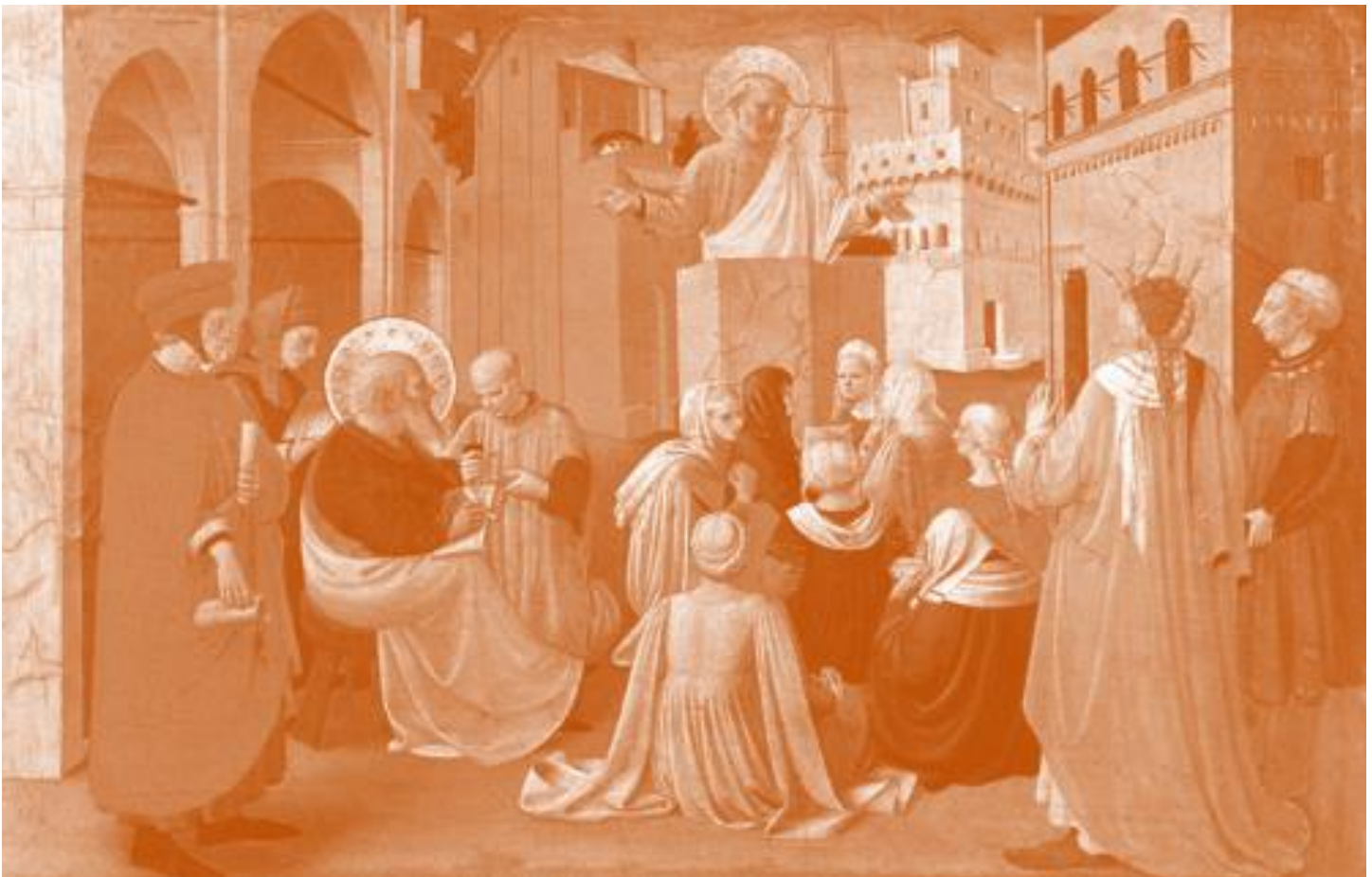
Fra Angelico, "St. Peter Preaching," 1433.

La Oficina de Planificación Pastoral y el Departamento de Evangelización visitan las parroquias regularmente para brindar apoyo en la formación de Pastorales con el enfoque hacia el discipulado misionero y la planificación Pastoral. Al discutir las formas en que la esencia del discipulado misionero ya se está viviendo, estas oficinas pueden sugerir oportunidades para construir un sentido de misión compartido entre el personal, el liderazgo y los feligreses tanto en los Pastorales con una sola parroquia como en los Pastorales multi-parroquiales. Esto incluye estudios autodirigidos y discernimiento, así como conversaciones facilitadas por el personal arquidiocesano. Póngase en contacto con la Oficina de Planificación Pastoral o el Departamento de Evangelización para obtener ayuda con ideas para la formación.